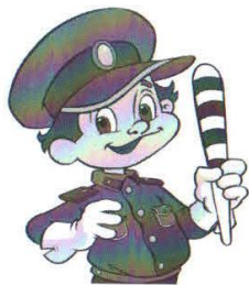
График на педагогически ситуации по „Безопасност на движението по пътищата“ ДГ №40 „Проф. Г.Ангушев“ за учебната 2021-2022година